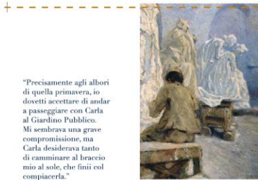
UGO FLUMIANI Sculture sotto studio, 1950

"La salute non analizza sé stessa e neppure si guarda allo specchio. Solo noi malati sappiamo qualche cosa di noi stessi."