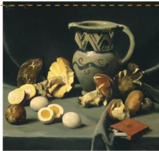
BRUNO CROATTO Natura morta con baccellati, 1947

Museo d'Arte Moderna "Ugo Carà" via Roma 9, Muggia (TS)