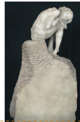
GIOVANNI MAYER Fragole, 1930

"Precisamente agli albori di quella primavera, io doveti accettare di andar a passeggiare con Carla al Giardino Pubblico. Mi sembrava una grave compromissione, ma Carla desiderava tanto di camminare al braccio mio al sole, che finii col compiacerla."