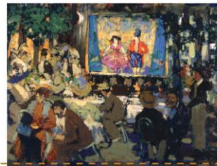
ADOLFO LEVIER Caffè all'opera, 1938

"Precisamente agli albori di quella primavera, io doveti accettare di andar a passeggiare con Carla al Giardino Pubblico. Mi sembrava una grave compromissione, ma Carla desiderava tanto di camminare al braccio mio al sole, che finii col compiacerla."