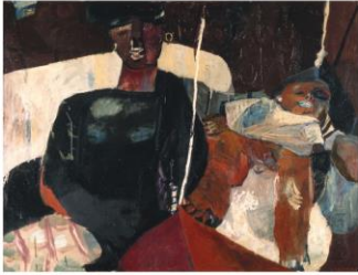
MIELA REINA Madre e figlio, 1959

Una mostra suggestiva per celebrare i 100 anni della pubblicazione del più famoso tra i romanzi di Italo Svevo "La coscienza di Zeno" tramite opere scelte di artisti tra Ottocento e Novecento custodite nella Collezione d'Arte della Fondazione CRTrieste. L'esposizione, curata da Alessandro Del Puppo, è organizzata dall'Assessorato alla Cultura del Comune di Muggia e dalla Fondazione CRTrieste e si inserisce nel calendario delle iniziative culturali della Barcolana, la regata più grande del mondo.