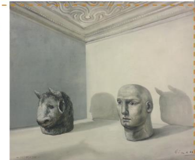
RICARDO CINALLI Invocazione, 1909

"Ma chi può arrestare quelle immagini quando si mettono a fuggire attraverso quel tempo che giannini somigliò tanto allo spazio? Quest'era il mio concetto finché credetti nell'autenticità di quelle immagini!"