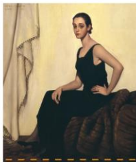
Ritratto di giovane donna in abito nero, 1951

"Le prime sigarette ch'io fumai non esistono più in commercio. Intorno al '70 se ne avevano in Austria di quelle che venivano vendute in scatoline di cartone munite del marchio dell'aquila bicipite".